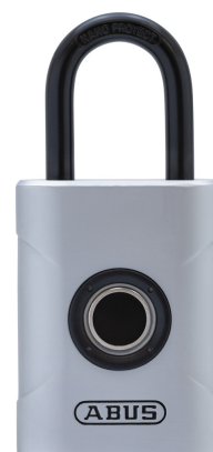
Bilder och andra dokument av produkten